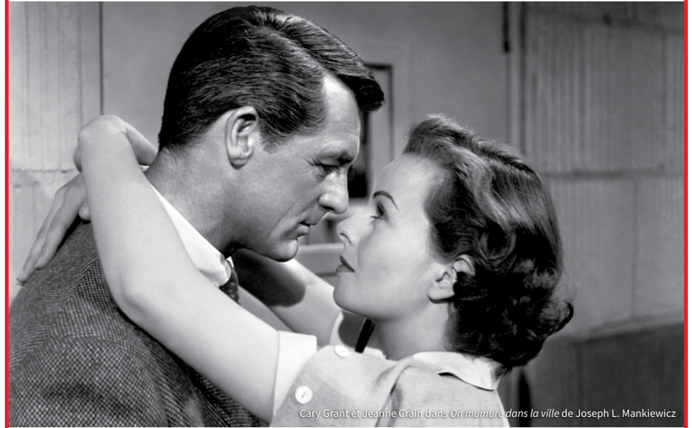
Cary Grant et Jeanne Crain dans On murmure dans la ville de Joseph L. Mankiewicz

Lumière Classics est le label du festival destiné à soutenir – et cette année plus que jamais – une sélection de films restaurés. Ainsi, à l'intérieur du festival, des films restaurés et apportés par des archives, des producteurs, des ayants-droits, des distributeurs, des studios et des cinémathèques bénéficient d'un écran particulier.