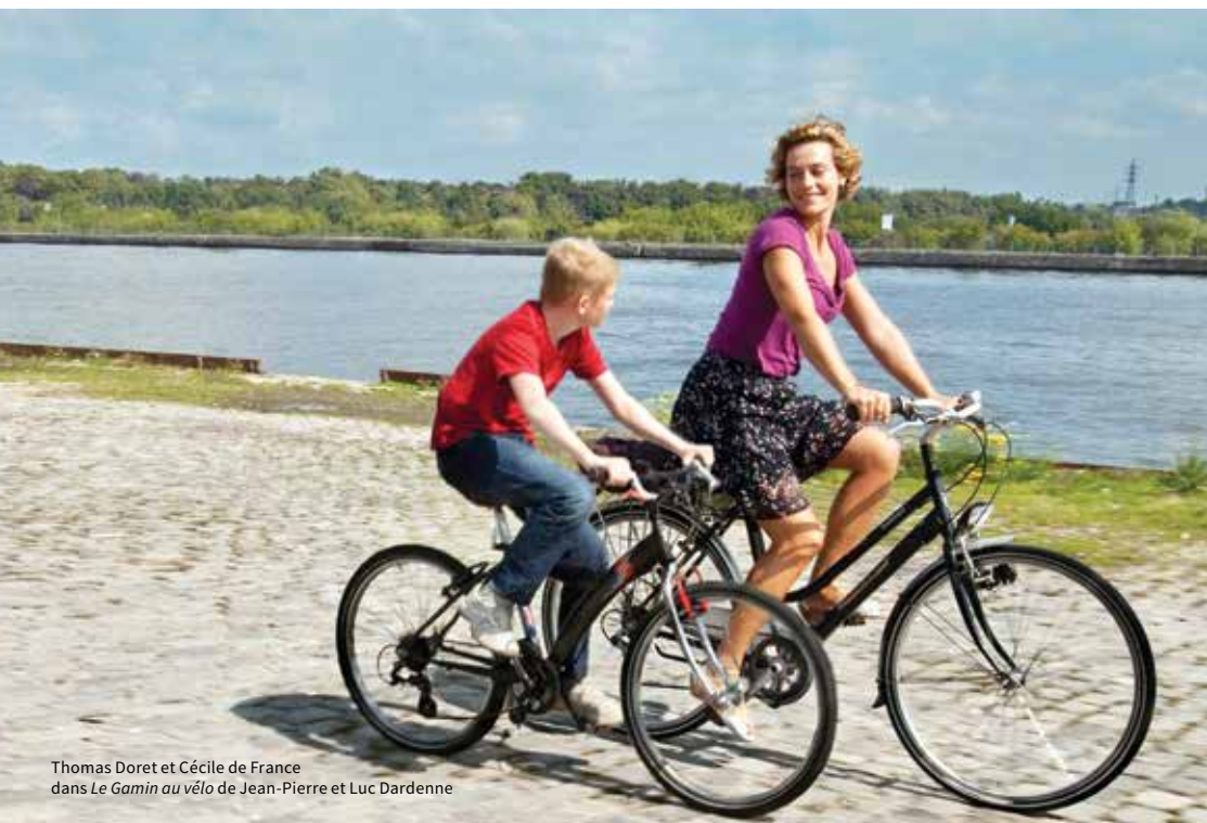
Thomas Doret et Cécile de France dans Le Gamin au vélo de Jean-Pierre et Luc Dardenne